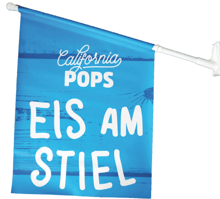
Fahne 47 x 64 cm