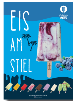
Plakat (Druckunterlage) für A1, A2, A3 und A4