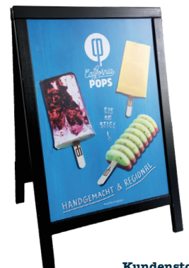
Kundenstopper 55 x 86 cm