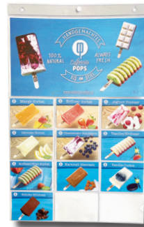
Preisdisplay 73 x 36 cm