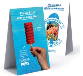
Tischaufsteller 10 x 16 cm